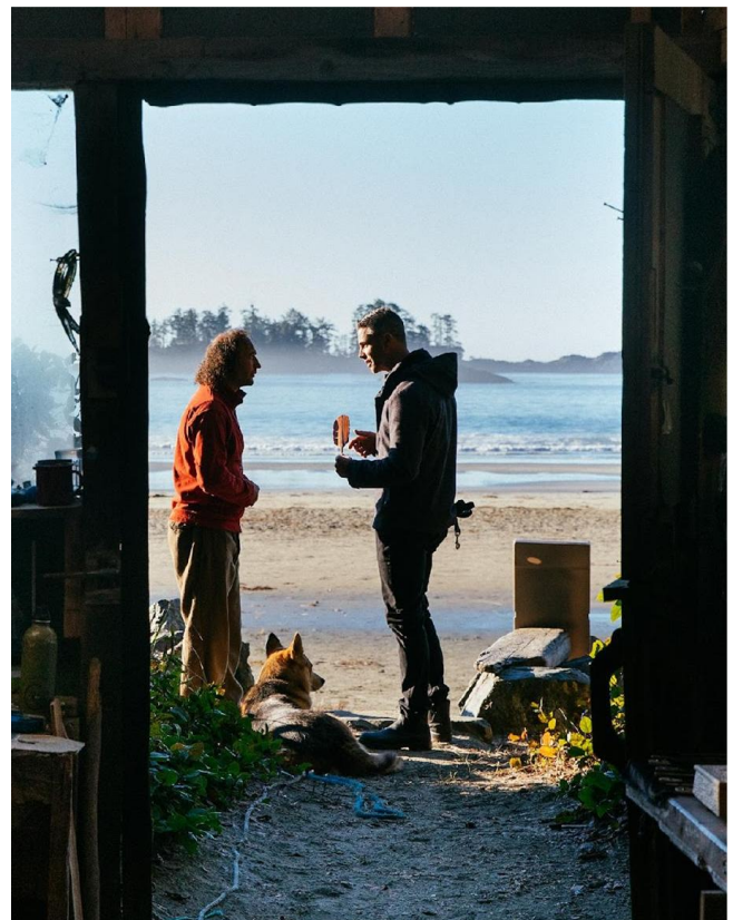
Left: © La Meridiana_Giuditta Rossetti – Right: © Wickaninnish Inn